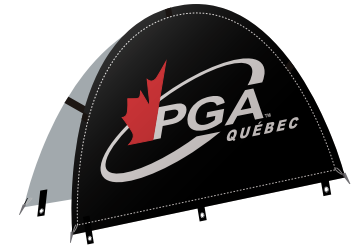
Affiche en demi-lune 170$