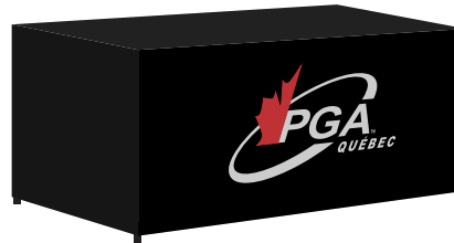
Nappe ajusté 6 pi Panneau avant 170$