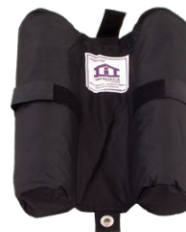
sacs de poids 40$ (ensemble de 4)