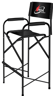
Chaise directeur 125$ Grand, Imprimé double face