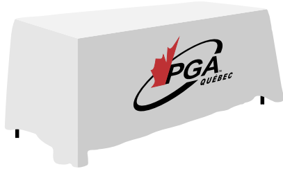
Housse de table 6' Numérique complet 225$