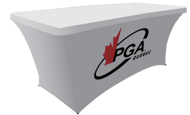
Nappe extensible 6 pi Numérique complet 215$