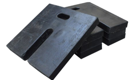
Poids en caoutchouc 45$

Taxes et frais d'expéditions sont supplémentaires.